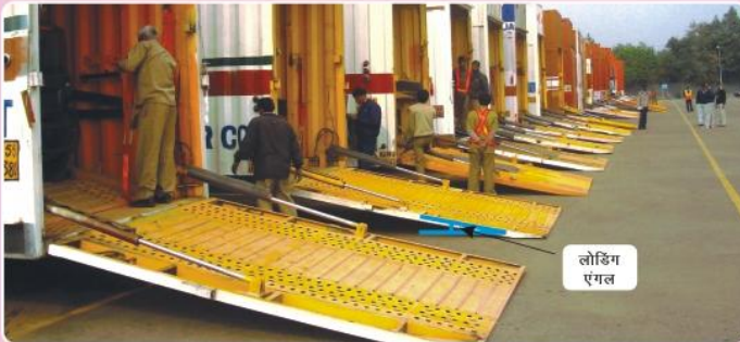
लोडिंग एंगल 12 डिग्री से कम रखा जाना चाहिए